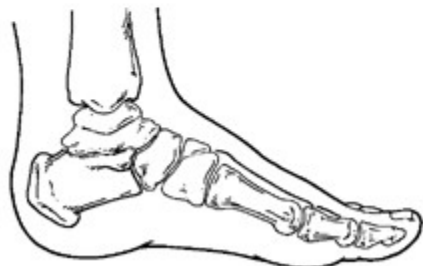
Pie pediátrico normal

La mayoría de los niños que tienen el pie plano no presentan síntomas, pero algunos niños sufren uno o más síntomas. Cuando los síntomas se presentan, varían de acuerdo con el tipo de pie plano. Algunas señales y síntomas pueden incluir: