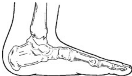
Pie plano pediátrico

¿Cuándo es Necesario Recurrir a la Cirugía?